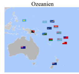
大洋洲 (dà yáng zhōu)