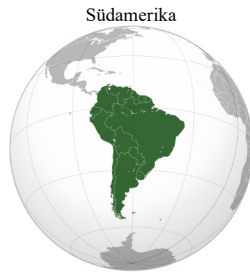
南美洲 (nán měi zhōu)